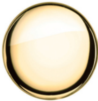
Laiton poli verni brillant

chromé, laiton chromé satiné, inox brossé.