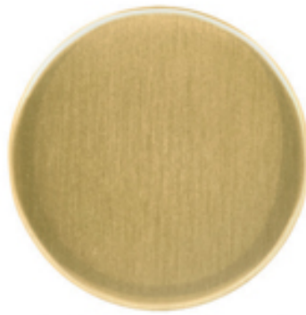
Laiton brossé verni mat