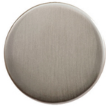
Inox brossé verni mat