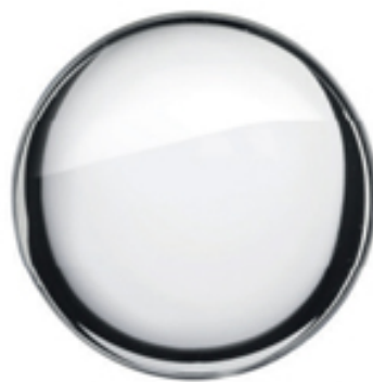
Laiton chromé poli brillant